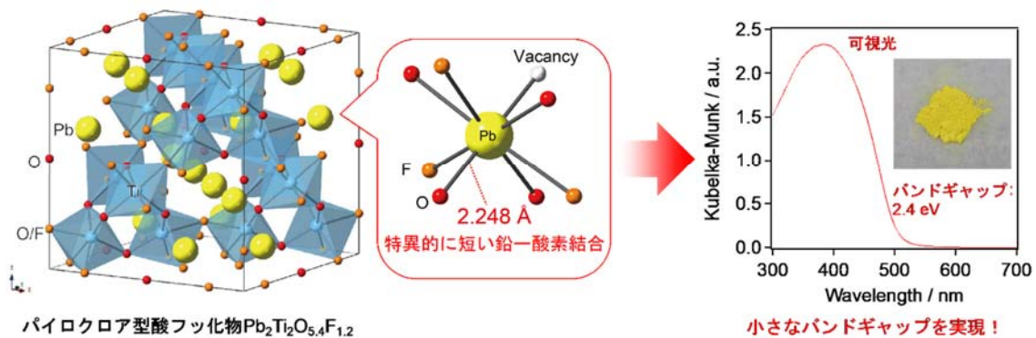
図 2. パイロクロア型酸フッ化物 \text{Pb}_2\text{Ti}_2\text{O}_{5.4}\text{F}_{1.2} の結晶構造と光吸収特性